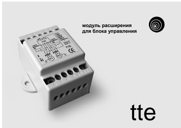
модуль расширения для блока управления

Nice Польша Прушкув Тел. +48-22-728-33-22 Факс +48-22-728-25-10 nice@nice.com.pl