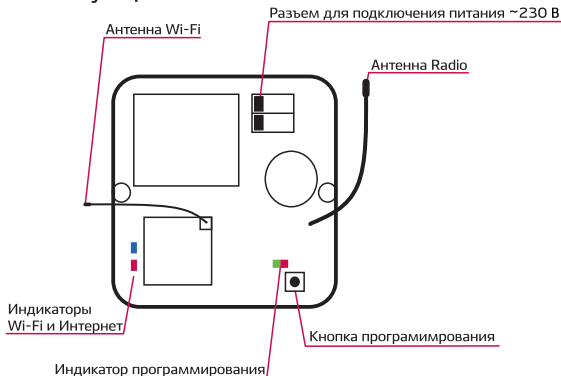
Рис. 1 - Мини-сервер 8767

Управление мини-сервером 8767 производится с помощью мобильного приложения Nero Server, установленного на мобильное устройство с операционной системой iOS или Android.